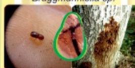
BARRENADOR DE TALLO Xyleborus sp.