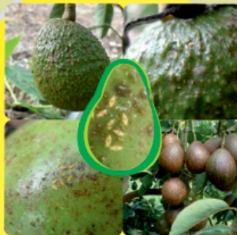
THRIPS DE BANDA ROJA Selenothrips rubrocinctus