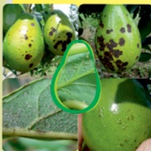
COMPLEJO DE CHINCHES MANCHADORES DE FRUTO