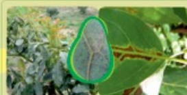
Enves de la hoja