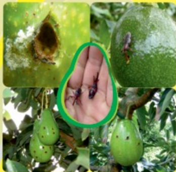
PICUDO GRANDE DEL AGUACATE Heilipus lauri