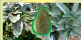
Haz de la hoja ACAROS