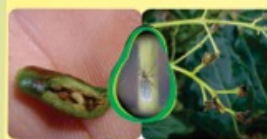
MOSCA DEL OVARIO Bruggmanniella sp.