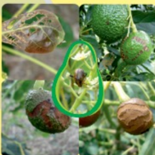
CUCARRÓN MARCEÑO Orden: Coleoptera