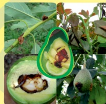
PASADOR DE RAMAS Y FRUTOS Stenoma catenifer

aguacatelaspalmeras@hotmail.com cel: 3113404797 - 3122590537