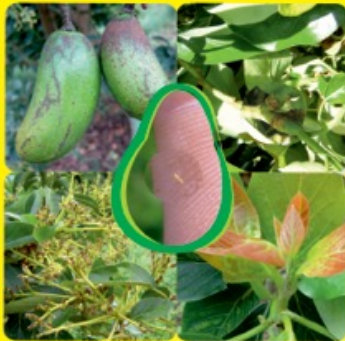
THRIPS - BICHO CANDELA Frankliniella occidentalis