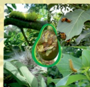
GUSANOS COMEDORES Orden: Lepidoptera

Km 41 via Manizales-Medellin Vereda Colombia-Manizales, Caldas - Cel 3113404797-3122590537 aguacatelaspalmeras@hotmail.com